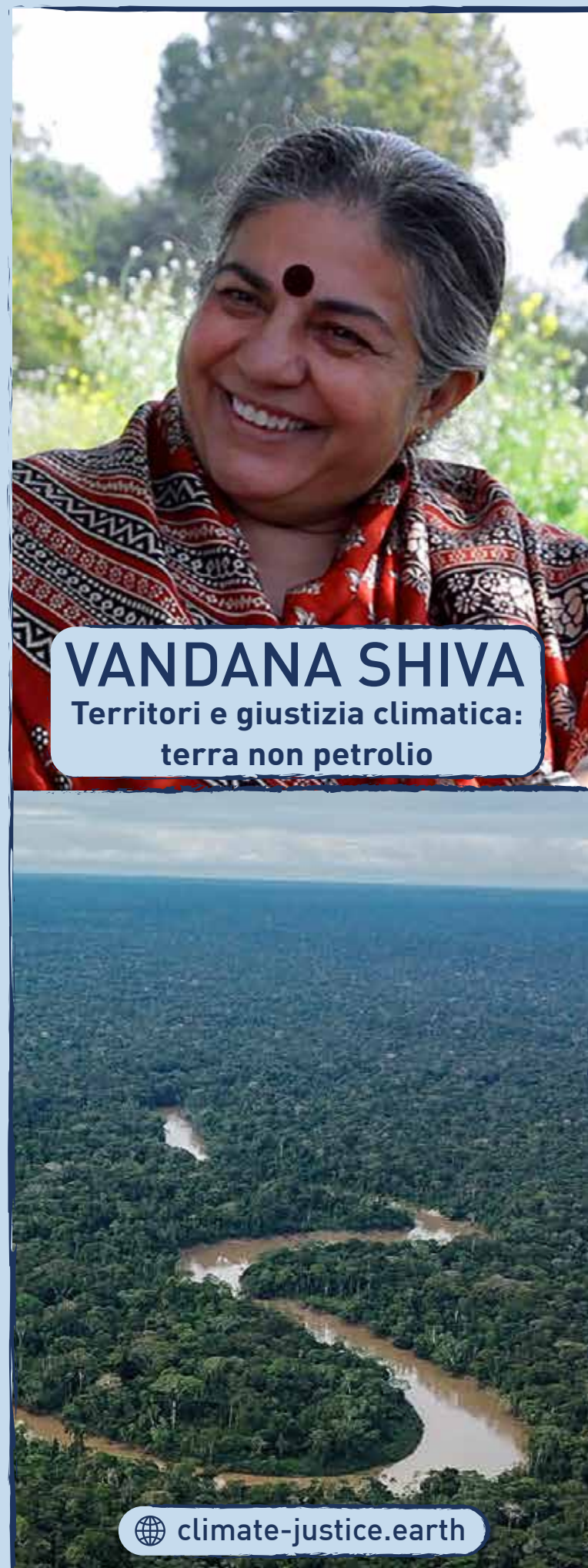
VANDANA SHIVA Territori e giustizia climatica: terra non petrolio

Dibattito | 13.30 - Conclusione prima sessione